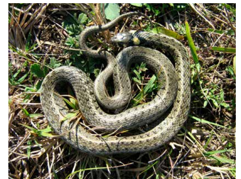
Vízisikló (Natrix natrix)