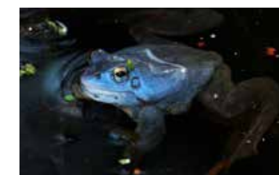
Mocsári béka kék nászruhában