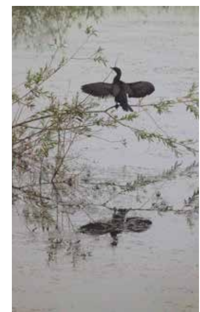
A fokozottan védett kis kárókatonát felületesen szemlélve össze lehet téveszteni a nagy kárókatonával

Az ember rendkívüli módon beavatkozott az őshonos élővilág és az eredendően érintetlen természet rendjébe, még ha nem is igazán ez volt a célja. A Rába sem maradt ki a sorból, bár egyes részei még ma is egészen vadregényesek. Alsószőlőnk és Csákványdoroszló közötti szakasza az Őrségi Nemzeti Park részeként országo-