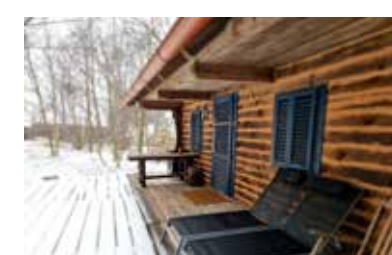
Az „Őrségi boronaház”

A táj csöndje, érintetlensége, és az Őrségi ízei, építészete ragadta meg. Őt éven át Magyarföld polgármestere volt, megálmodta és megvalósította a falu fatemplomát és a hozzá kapcsolódó összművészeti fesztivált. Büszke a megmentett épületekre, az értékes barátságokra és arra, hogy a gyermekei is szorosán kötődnek ehhez a vidékhez.