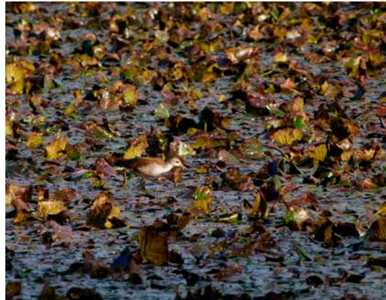
Rába holtágának sulymos növényzetén táplálkozó kis vícisíbe

A Rába körülbelül 200 km-nyi magyarországi szakaszának legnagyobb részével Igazgatóságunk működési területe, végeredményben Vas vármegye érintett. Többben elsősorban horgászati-, vagy vadvízi sportlehetőségként gondolnak hazánk harmadik leghosszabb folyójára, nekünk azonban elsősorban sérülékeny, természetközeli élőhelyként, a növény- és állatvilágnak otthont adó területként jut eszünkbe.