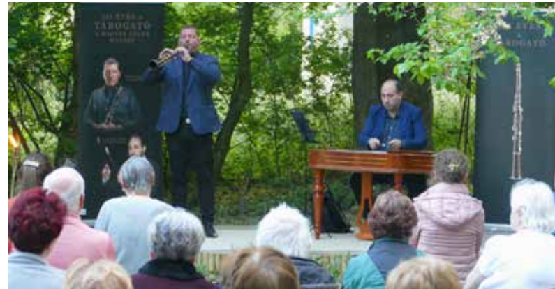
Koncert a Chernel-kertben – Fotó: Németh Iván

Az Írótkő Natúrparkegyesület fotópályázatát hirdették, és a kőszegi iskolákkal közösen városi természetvédelemről szóló programot szerveztek. A Felsőbükfői Tanulmányok Intézete Chernel-sétát vezetett, Festetics-Chernel szimpóziumot és konferenciát tartott, mely a tudós család kapcsolatrendszerét mutatta be. A Chernel István Cserkészcsapat gyermeknap rendezvényt is szerveztek.