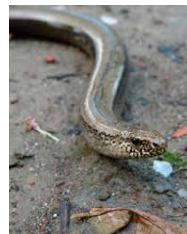
Lábatlangyik (Anguis fragilis)

A kételtűekkel és hüllőkkel kapcsolatban számos alaptalan tévhit kering a köztudatban, ami többnyire ellenszenvet kelt az ember számára nagy hasznot hajtó, és természetvédelmi oldalról alátalálható állatokkal szemben.