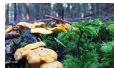
„Egy régi szalafői reggel bízsergető dokumentuma.”

jövök megint haza. Ezen mindig meglepődöm. Nagy boldogság nekem, hogy befogadtak, mert ez azt jelenti, hogy talán nem vagyok olyan rossz ember, és a lelkütem képes egybeolvadni az itt élőkkel és a tájjal.