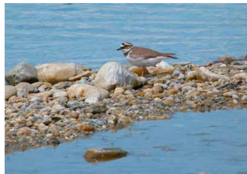
A kavicsátonyok és a kapcsolódó kavicsbányatavak jellegzetes fészkelője a kis lile