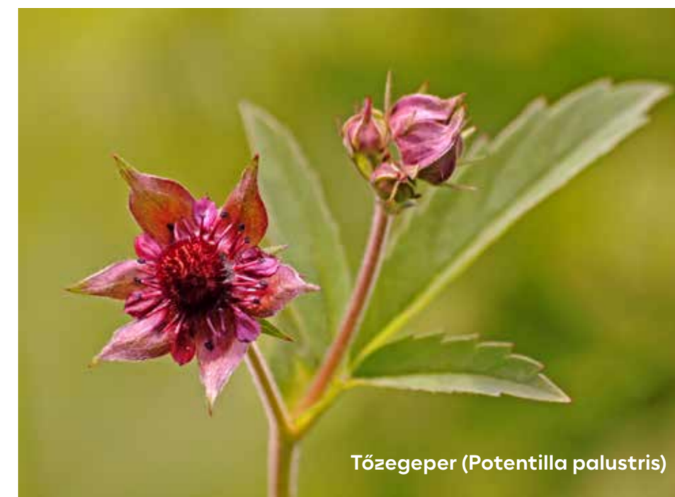
Tőzegeper ( Potentilla palustris )

Igazgatóságunk működési területén tavaly több védett növény- és állatfaj új előfordulását, illetve populációméretének növekedését dokumentáltuk.