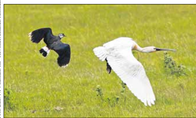
A nemzeti park számtalan madárfaj élőhelye – itt épp egy bicic riaszt fel egy kanalasgémet.

jellemző fajgazdasága miatt kimondottan attraktív célpont szakértők és tudósok körében, a képzési tevékenységek szintén jelentősen hozzájárulnak az ökoturisztikai sikerhez.