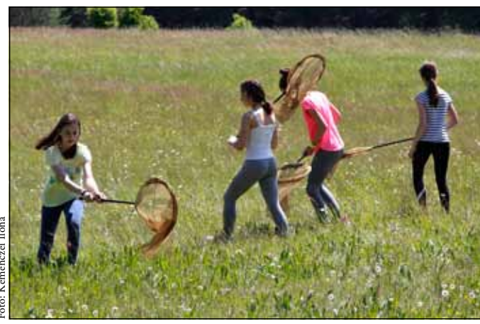
A lepkefelmérés nem csak hasznos, hanem élvezetes elfoglaltság is.

potú rétek és erdőszegélyek, ahol sokféle lepkefaj talál magának élőhelyet. Lepkészeinket ellátjuk minden szükséges eszközzel is, lepkehálókat kapnak és hozzájutnak a legfrissebb kiadású magyar nyelvű lepkehatározó könyvhöz is. Olyan okostelefonos alkalmazást is kifejlesztünk a számukra, amelynek segítségével könnyedén rögzíthetik megfigyeléseiket a terepen, és adataikat automatikusan egy adatbázisba juttatja. Így az adatok szinte azonnal egy térképre is kerülnek, amelyen a résztvevők láthatják saját eredményeiket is. Ilyen módon az önkéntesek egy teljesen új technológiával ismerkedhetnek meg.