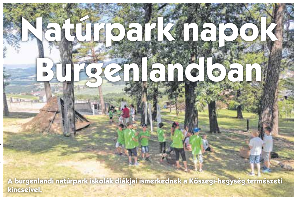
A burgenlandi natúrpark iskolák diákjai ismerkednek a Kőszegi-hegység természeti kincseivel.

TÖBB MINT 400 GYERMEK FEDEZTE FEL A GESCHRIEBENSTEIN-ÍROTTKŐ NATÚRPARKOT – A Regionalmanagement Burgenland szervezésében második alkalommal kerültek megrendezésre a Natúrpark napok a „PaNaNet+” projekt keretében. A rendezvény során több mint 400 gyermek, köztük 14 natúrpark iskola diákjai, 2 natúrpark óvoda növendékei, valamint egy magyar általános iskola diákjai fedezték fel a Geschriebenstein (Írottkö) Natúrpark különlegességeit: lehetett szó akár denevérekről, énekes madarokról vagy régi mesterségekről – a gyerekek nagy lelkesedéssel vettek részt a programokon.