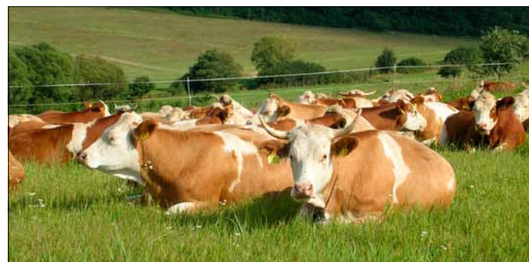
Magyartarka gulya a patkai-legelőn.

Hagyományos, veszelézetett magyar fajta, melynek egyik kialakulási tenyészkörzete erősen kötődik az Őrséghez. A fajtaválasztásnál lényeges szempont volt, hogy ez a marha jelenleg is piacképes, alkalmas a természetvédelmi területek kezelésére és egyedszámának drasztikus csökkenése miatt oltalomra is szorul. Nagyon jó hústermelő képességgel rendelkezik, ellenálló, jól bírja a ridegtartást. Csaknem 600 egyedből álló állományunk van, amelyből több mint 200 a tehén. A bikákat hizlaljuk és vágóhídon értékesítjük, az üszökből pedig tenyészűzök lesznek. Szerencsére a magyartarka keresett fajta. Érdekeség,