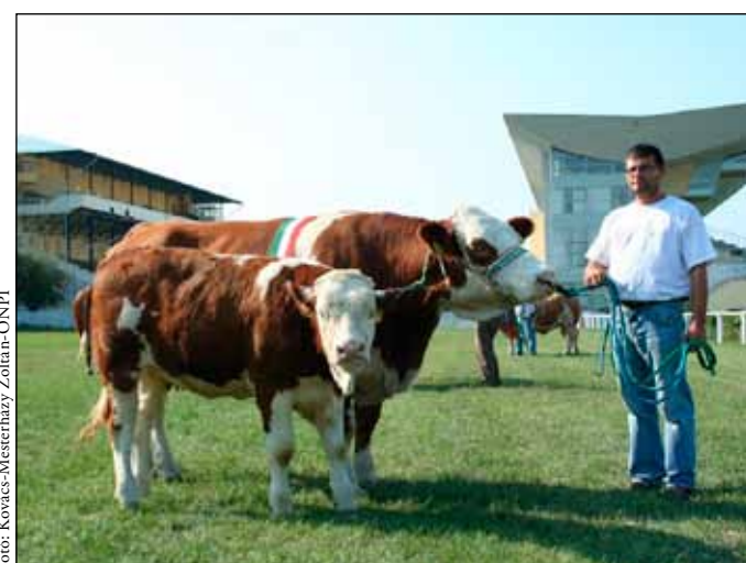
OMÉK nagydíjas magyartarka tehén borjával.