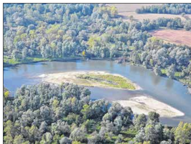
A vadregényes Mura, mint határfolyó eddig nehezen megközelíthető célpont volt a vízituristák számára.

A desztináció vízi túrázókat és a térségi lakosság körében való népszerűsítésére, a termék bevezetésére vízi fesztivált szerveznek. Mivel a folyó gyors sodrású és veszélyes víz, így a túrák biztonságos lebonyolításához túravezetőket képeznek ki nemzetközi sztenderdek alapján. A nemzeti park törekvései és tevékenységei által a Mura folyó és térsége néhány éven belül bekerülhet a nemzeti és nemzetközi vízi turisztikai célpontok sorába.