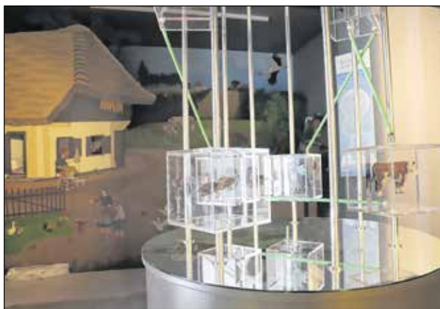
A nemzeti park természeti értékeit egy látványos kiállítás mutatja be.

terméket vagy szolgáltatást. Így próbáljuk hangsúlyozni a természet ezen darabjainak ökoszisztéma szolgáltatásait és a belőlük élő közösségek jelentőségét. A tornyok alsó részében számítógép és hozzá kapcsolódó monitor található, amelyen a helyes gazdálkodási gyakorlattal, igazgatóságunk tevékenységével kapcsolatos ismeretterjesztő rövidfilmek nézhetőek meg.