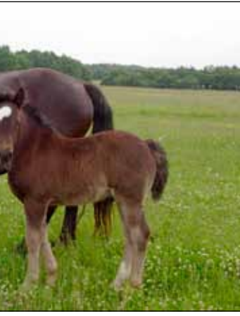
Muraközi kancacsikó az anyjával.

rák tartományokból behozott lovakat kereszteszték az ittenekkel, amelyek amúgy magukon viselik az arabos jegyeket. Így egy erős, szívós, de nemes megjelenésű ló alakult ki, ez a muraközi ló. Jó esély van arra, hogy meg tudjuk őrizni ezt a típust, s