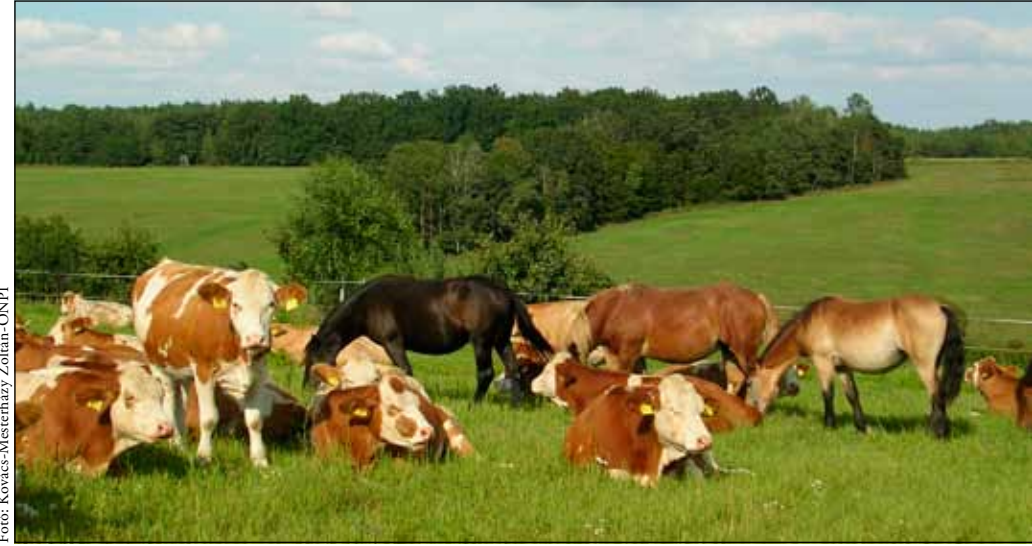
Murák és marhák egy szalafi legelőn.

Amikor megalapították az Őrségi Nemzeti Parkot, teljesen más viszonyok uralkodtak a magyar agráriumban, mint ma: 2002-ben még számtalan szántó és gyepterület volt. Az őrségi állatállomány is drasztikusan csökkent a '90-es években, töredéke volt annak, amely fenn tudná tartani a természetvédelmi