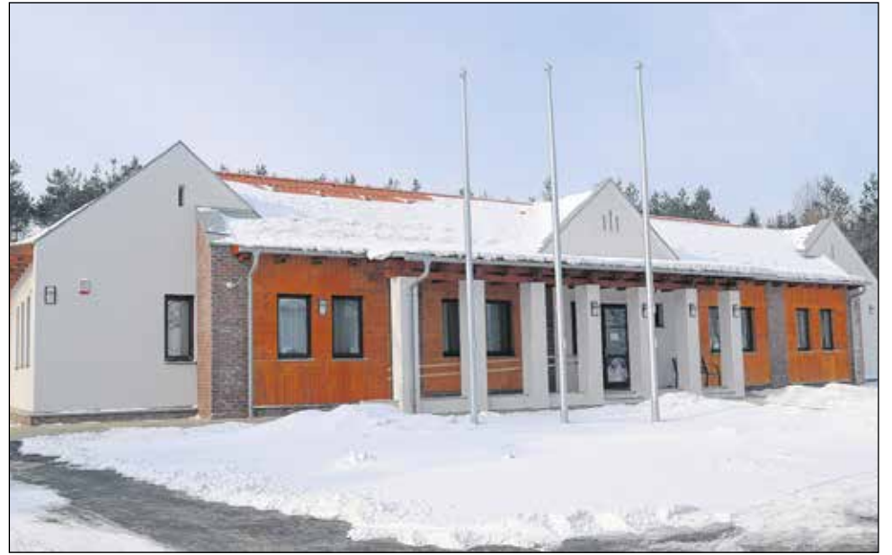
Az új Natura 2000 látogatóközpont egyben az igazgatóság székháza is lesz.

Ezen a helyzeten kívántunk változtatni fejlesztésünkkel, amely a Natura 2000 területeinket egy bemutató hálózat