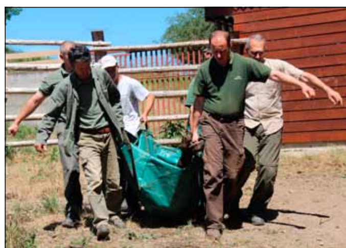
A kamionra elaltatva kerültek a bölények Kistapolcsányban

Az európai bölényből sík- és hegyvidéki (Kaukázusi) alfaj létezik, az utóbbi a ritkább és már nem tiszta vérvű, mivel az ember a szabad természetből teljesen kipusztította, fogságban is csak egy maradt belőle. De ennek a bikának az utódait mindig úgy párosítják, hogy a hegyvidéki jelleg lehetőség szerint megmaradjon. Az Őrségi bölények is tőle származnak, de a szaporítás miatt van bennük sikvidéki vér is. Magyarországon máshol nem látható Kaukázusi bölény. Tervezzük az állományunk bővítését, így ha a nagyobb terület kerítése elkészül, lehetséges, hogy hozunk még további bölényeket.