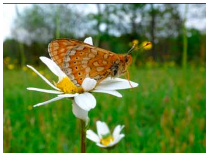
Lápi tarkalepke – Euphydryas aurinia

lehetőséget biztosít. Ez utóbbi annál is értékesebb hozzájárulás, mivel Németországban nagy hagyománya van a természetvédelmi önkéntességnek és sok nemzeti parkban több önkéntes dolgozik, mint hivatásos alkalmazott. Hazánkban elsőként az Őrségi Nemzeti Park lépett rá erre az útra és vállalta azt is, hogy tapasztalataival segíti a másik kilenc nemzeti parkot is ezen az új területen.