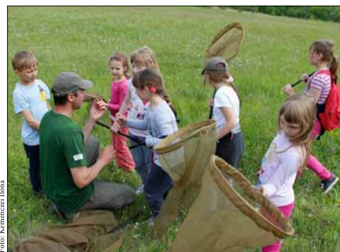
A felmérőket elméleti és gyakorlati képzésben is részesítjük.

Egyre többen gondolják azt egy természeti szépség, például az üde zöld színekben pompázó, változatos Őrségi táj láttán, hogy tenni szeretnének azért, hogy megmaradjon és gyermekeik, unokáik is gyönyörködhessek benne. Sokakat megérint, ha látják, hogyan pusztul körülöttük a természet, hogyan foglalja el például egy ipari park annak