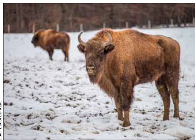
Európai bölény Szalafőn

Egyrészt szeretnénk bemutatni a nemzeti parkban azokat az állatokat, amelyek korábban itt éltek, részei voltak a természetnek. Elsősorban a növényevő nagyméretű gondoltunk, ezért is van itt az európai bölény, valamint az eurázsiai vadló. A bölény egészen a 18. századig vadon előfordult a Kárpát-medencében, utoljára Erdélyben élt. A középkorban még vadászta rá, királyi kiváltság volt a legnagyobb testű, európai szárazföldi emlős eljete. A kontinens nyugati feléről már korábban kihalt, utoljára a lengyelországi Bialowieza őserdőben maradt állomány, amelynek sorsát aztán az első világháború pecsételte meg. Így az európai bölény sikvidéki alfaja kipusztult, hegyvidéki alfajának utolsó szabadon élő példányát pedig az 1920-as években lőtték ki a